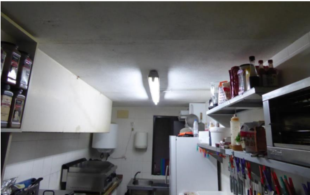
En Sanlúcar de Gadiana, a 26 de junio de 2018.